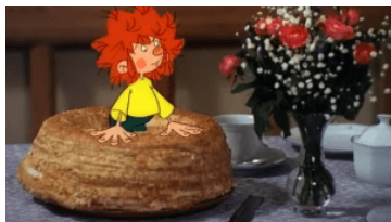
Happy Birthday, Pumuckl – unsere 11 liebsten Weisheiten